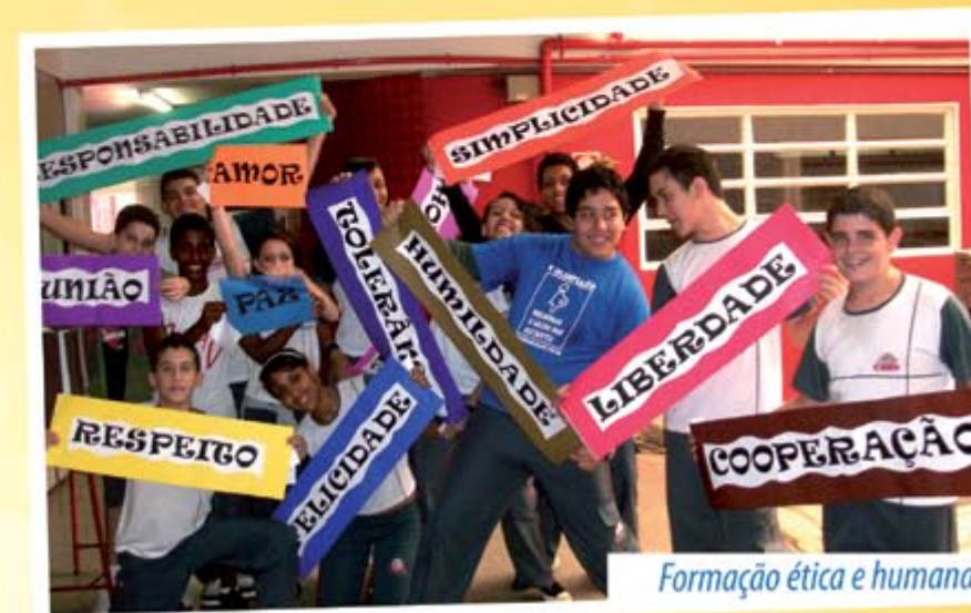
Formação ética e humana.

O Ceav Fundamental é uma Instituição que prioriza o desenvolvimento do hábito e do gosto pelo estudo. Nossos alunos nessa fase, além de um ensino de alto nível tem contato com disciplinas e atividades exclusivas. Essas disciplinas destacam, dentre outros, o respeito ao meio ambiente, valores familiares, ética e moral. É por esta razão que disponibilizamos os recursos e qualidade de uma grande escola. Dessa forma o professor tem uma visão mais ampla do aluno tanto na formação acadêmica quanto na formação sócio interativa.