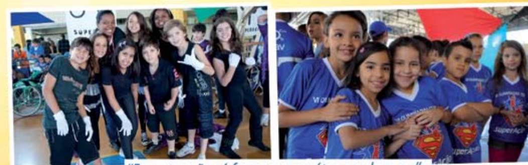
"Esportes não só formam o caráter, revelam-no"