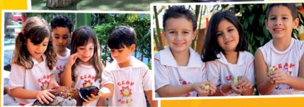
Momento de integração entre educação e natureza.