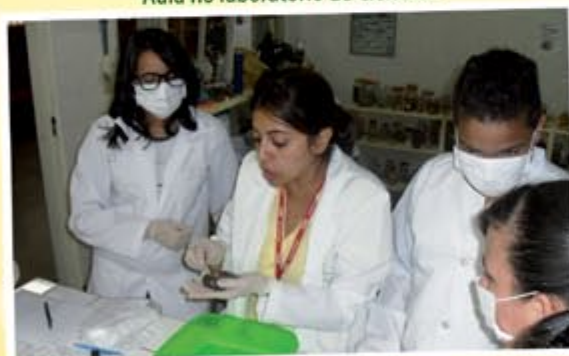
Aula no laboratório de Ciências.

Aulas práticas são desenvolvidas no laboratório de Ciências tecnológico onde os alunos vivenciam experiência de grande valor para o aprendizado do conteúdo teórico. No final do ano todos os trabalhos são apresentados na feira de ciências- Feiciart.