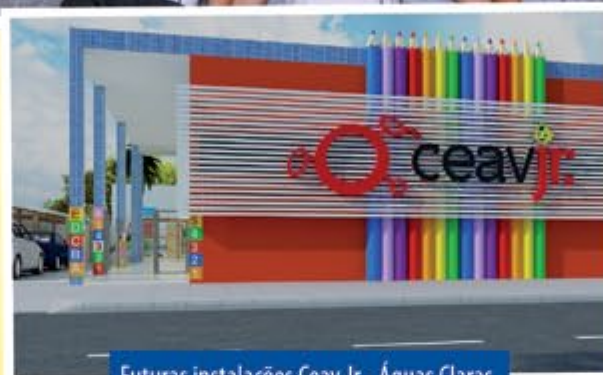
Futuras instalações Ceav Jr - Águas Claras